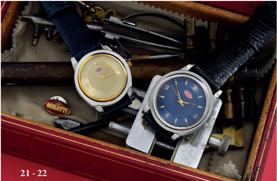
21 - 22