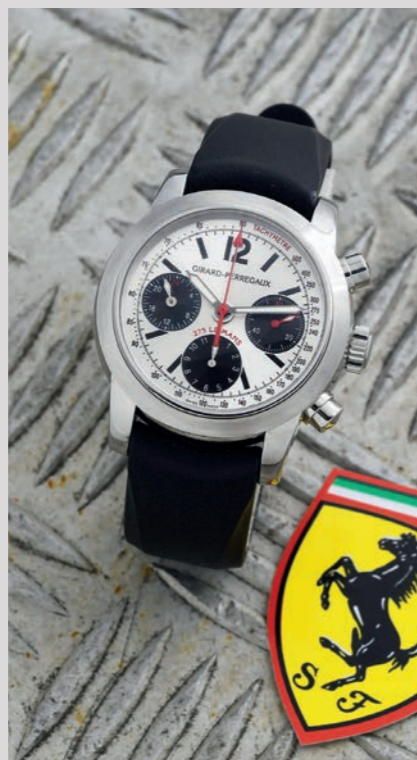
GIRARD PERREGAUX Ferrari 275 Le Mans