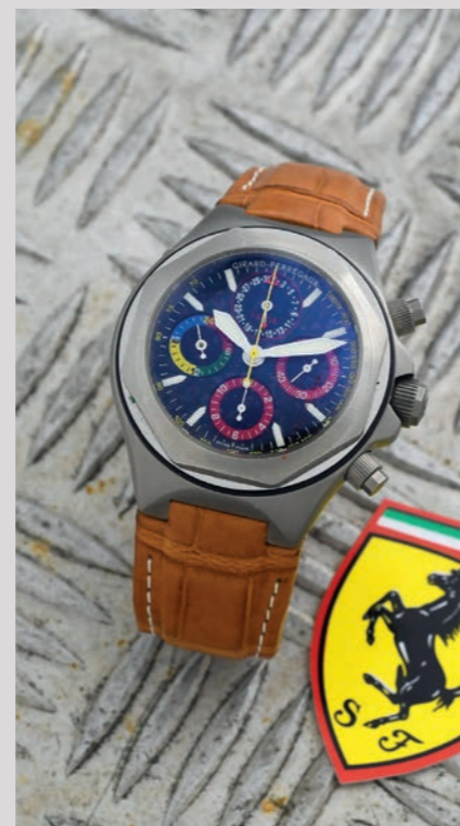
GIRARD PERREGAUX Ferrari F2004