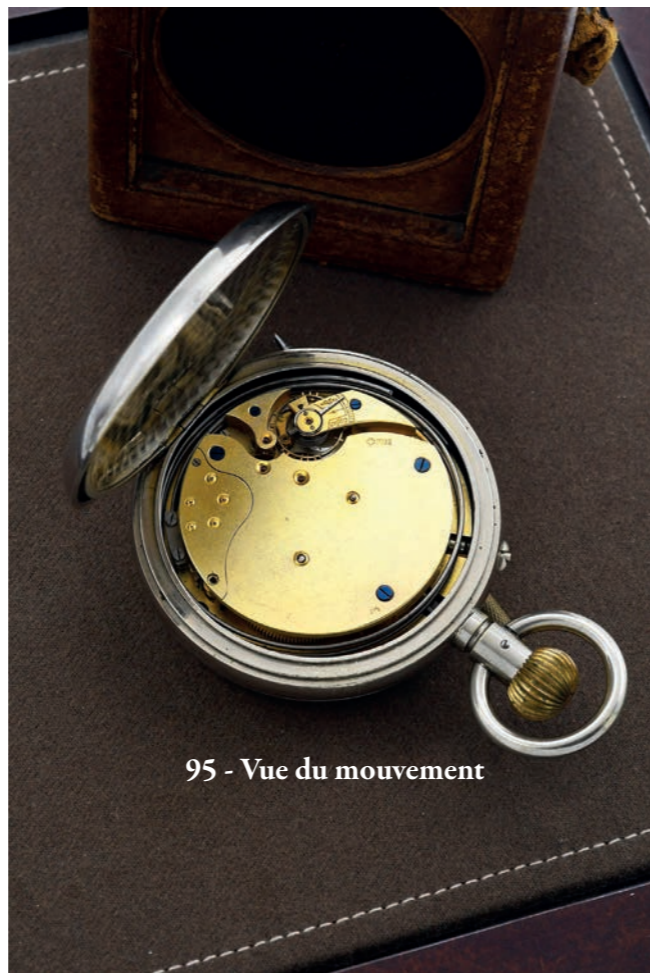
95 - Vue du mouvement