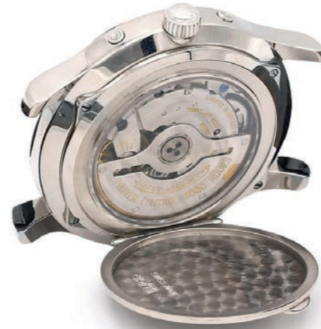
10 - Vue de dos, capot ouvert