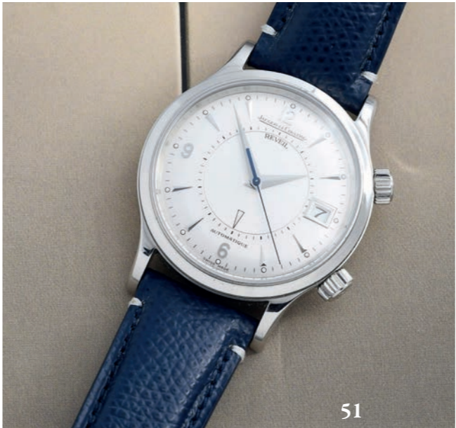
51 - JAEGER-LeCOULTRE MASTER CONTROL RÉVEIL AUTOMATIQUE SILVER RÉF. 141.8.97/1, VERS 2004

Montre réveil à grande ouverture version automatique certifiée 1 000 heures. Boîtier en acier à lunette lisse et fond vissé décoré et logotypé, orné du blason Master Control en or jaune (signé et numéroté). Cadran argenté brossé avec index flèche appliqués, points lumineux et aiguilles dauphine luminescentes. Disque du réveil avec une flèche pour le réglage au centre du cadran (réglage de la sonnerie par couronne à 2 h), guichet de la date à 3 h. Bracelet Jlc en crocodile noir (Crocodylia spp. CITES annexe II B) usagé à boucle déployante en acier Jaeger-LeCoultre d'origine et un bracelet sport en cuir bleu neuf. Mouvement : calibre mécanique à remontage automatique signé Jaeger-LeCoultre / 918 – 22 rubis Swiss Diamètre : 39 mm État : Très bon état ( Écrin, livret et certificat Jaeger-LeCoultre d'époque )