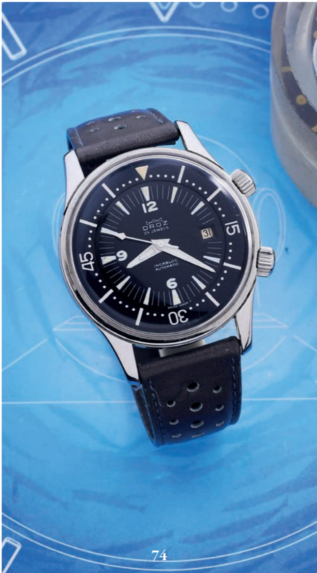
74 - DROZ PLONGEUR GT / SUPER COMPRESSOR - RÉF. 11.66 VERS 1966 Montre de plongeur Jaquet Droz à très grande ouverture en acier de la gamme Super Compressor, certaines de ces pièces furent en dotation dans l'Armée Américaine (produite à l'époque par les ateliers qui fabriquait les boîtiers de la mythique Jaeger-LeCoultre réveil Polaris). Boîtier à deux couronnes quadrillées et fond vissé (Logo des ateliers Compressor - numéroté brevet 317537). Cadran noir avec lunette intérieure sur le rehaut graduée sur 60 (actionnée par la couronne à 2 h), mise à l'heure par la couronne à 4 h, guichet de date à 3 h. Échelle d'index appliquées en tritium et larges aiguilles spatule luminescents. Bracelet en cuir huilé d'époque et un bracelet toile. Mouvement : calibre mécanique à remontage automatique ETA / 2472 Eta Swiss Diamètre : 42 mm État : Bon état ( Écrin plumier TOT )