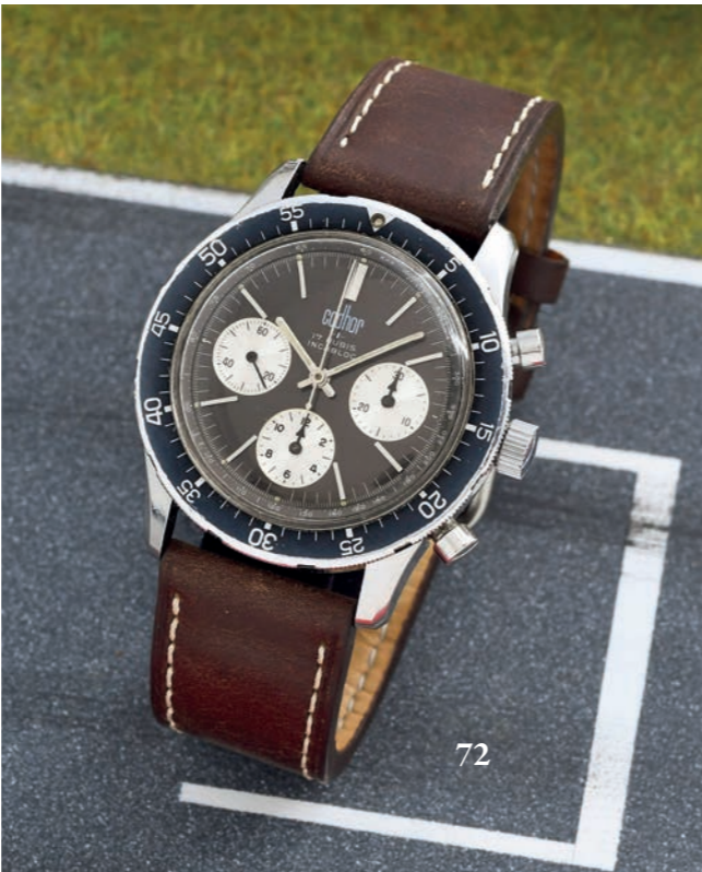
72 - CODHOR CHRONOGAPHE SPORT PANDA / INCABLOC 4 ATM - N° 442760 VERS 1969 Rare chronographe sport dit « 4 Atmosphère », dans la lignée des productions Jaeger France produit par les ateliers Dodane (boîtier similaire). Boîtier en acier à grande ouverture avec une lunette bidirectionnelle graduée sur 60 et fond vissé (signé étanche 4 ATM, Incabloc et numéroté). Cadran anthracite métallisé à trois compteurs argentés en creux : petite seconde à 9 h, compteurs des minutes à 3 h et des heures à 6 h. Échelle intérieure tachymétrique sur le rehaut, index appliqués et aiguilles lance luminescentes. Bracelet en cuir sport rapporté. Mouvement : calibre mécanique remontage manuel / Valjoux 72 Swiss Diamètre : 41 mm État : Bon état ( Écrin de transport )