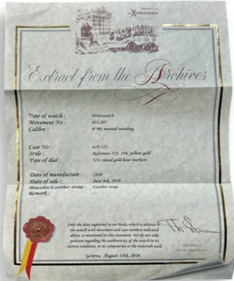
Certificat du lot 93