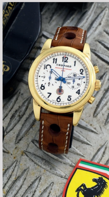
CHOPARD GP Monaco Historique 2002