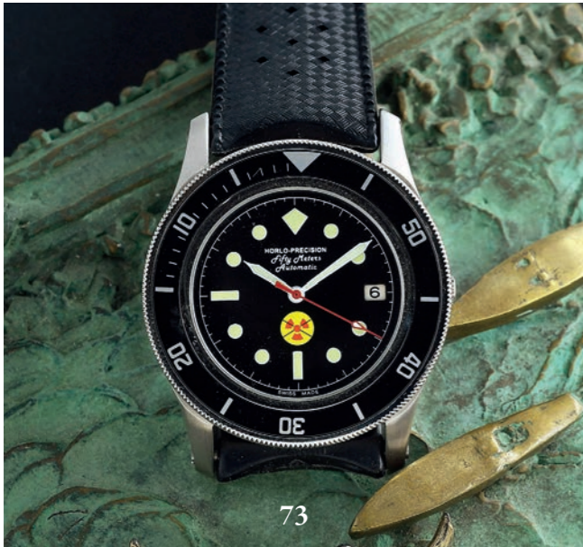
73 - HORLO-PRECISION FIFTY-METERS - PROTOTYPE - ERIS PARIS VERS 2004 Rare montre de plongeur produite à peu exemplaires (cette pièce prototype sort de la collection de l'ingénieur René Bruyeron, créateur de la marque TOT), hommage à la mythique Blancpain Fifty Fathoms des années 60. Boîtier en acier microbillé à fond vissé et verre saphir (mouvement apparent, numéroté sur 50), anses corne avec vis des deux cotés. Cadran noir laqué à index pastilles luminescents, logo No-Radiation à 6 h, date guichet à 3 h et aiguilles squelette luminova. Grande trotteuse rouge. Bracelet en caoutchouc Tropic des années 60 et un cuir sport TOT. Mouvement : calibre mécanique remontage automatique signé Eris Paris / ETA 2824/2 Swiss. Diamètre : 40 mm - État : Très bon état ( Écrin plumier carton HorloPrecision d'origine )