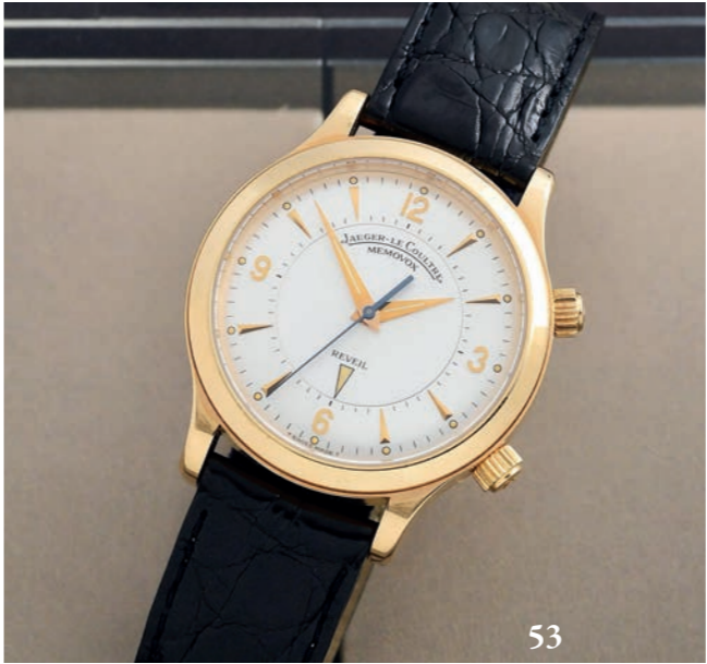
52 - JAEGER-LeCOULTRE MASTER MEMOVOX MECANIQUE / OR ROSE - RÉF. 144.2.94 VERS 2002

Rare version mécanique de la montre réveil « Memovox » des collections Master. Boîtier en or rose 18 carats (750 millièmes) à lunette lisse et fond vissé avec blason certifiée 1 000 heures appliqué (poinçonné, signé et numéroté). Cadran argenté avec index lance appliqués, points et aiguilles dauphine en or rose. Disque du réveil avec une flèche pour le réglage au centre du cadran (réglage de la sonnerie par couronne à 2 h). Bracelet de commande en crocodile (Crocodylia spp. CITES annexe II B) à boucle ardillon JLC en or rose 18 carats (750 millièmes) d'origine. Mouvement : calibre mécanique remontage manuel signé Jaeger-LeCoultre / 914 Swiss Diamètre : 36 mm État : Très bon état ( Écrin, certificat et livret Jaeger-LeCoultre d'origine ) Poids brut : 75,40 g