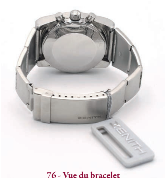
76 - Vue du bracelet