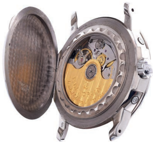
8 - Vue de dos, capot ouvert