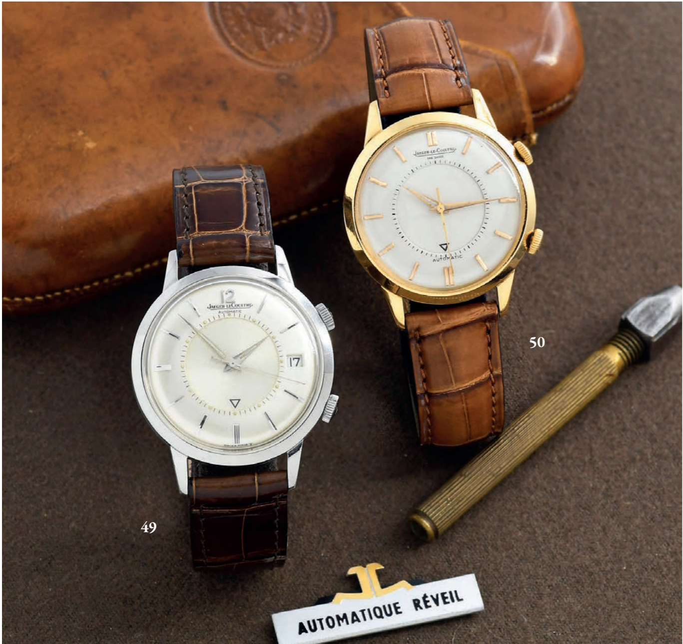
49 - JAEGER-LeCOULTRE MEMOVOX GT - SILVER - RÉF. E855 VERS 1965

Élégante version grande ouverture de la montre réveil dit « Memovox ». Boîtier rond en acier à fond vissé avec une bague (signé LeCoultre, Memovox et numéroté). Cadran argenté métallisé à chemin de fer, index appliqués, points et aiguilles dauphine squelette luminescents. Disque central argenté brossé avec une flèche pour le réglage du réveil. Guichet de date à 3 h et couronne à 2 h pour la fonction réveil (couronnes siglées). Bracelet de commande en crocodile havane (Crocodylia spp. CITES annexe II B) à boucle ardillon Jaeger-LeCoultre. Mouvement : calibre mécanique automatique à butée signé Jaeger-LeCoultre / K 825 Swiss Diamètre : 37 mm État : Très bon état ( Écrin Jaeger-LeCoultre )