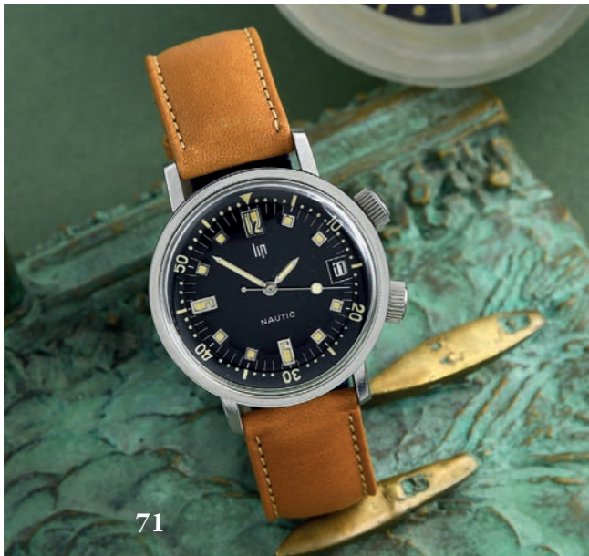
71 - LIP NAUTIC 20 ATU - MÉCANIQUE BLACK - RÉF. 42518 VERS 1966 Mythique montre de plongée des collection Lip Nautic dans une très rare version mécanique 2 ème génération. Boîtier rond en acier des ateliers Compressor à fond vissé en acier brossé (signé LIP / gravé du logo compressor 61.439.0 et numéroté). Lunette tournante intérieure graduée actionnée par la couronne (2 ème génération) à 2 h. Larges index carrés appliqués jaunes patinés et aiguilles lance luminescents, trotteuse pastille et date guichet à 3 h. Livrée avec deux bracelets, un caoutchouc d'époque et un cuir box de commande. Mouvement : calibre mécanique remontage manuel LIP / R17 Swiss Diamètre : 36 mm État : Très bon état ( Écrin plumier Lip d'époque )