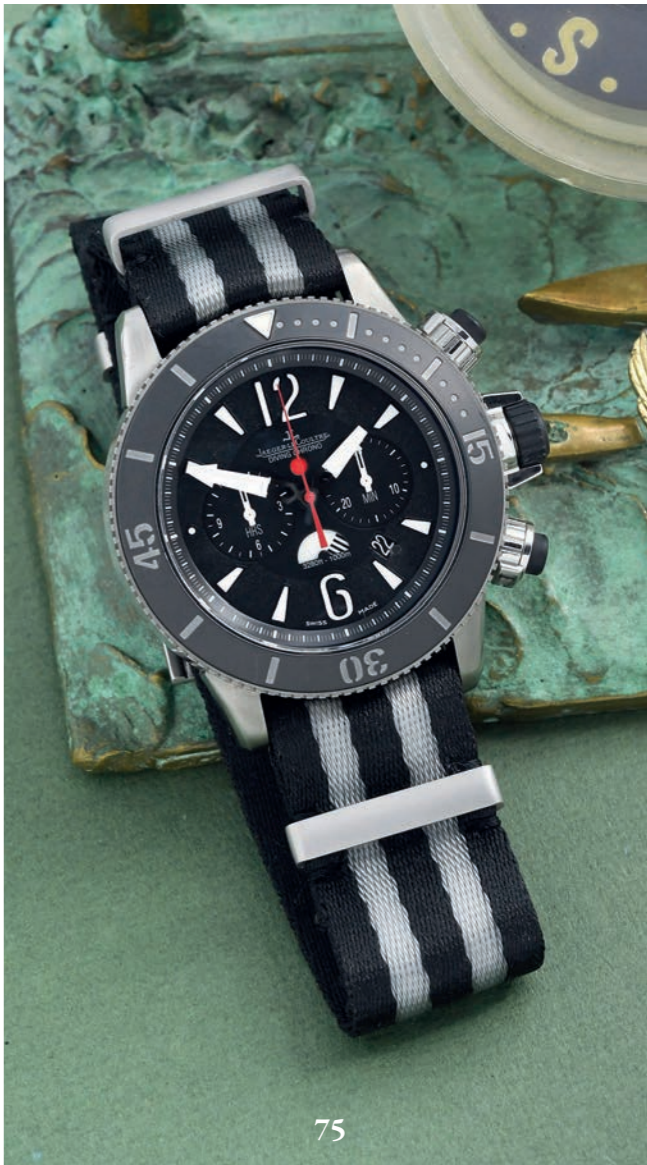
75 - JAEGER-LECOULTRE CHRONOGAPHE DIVING - MASTER COMPRESSOR NAVY SEALS GMT / TITANE - RÉF. 159.T.C7 / Q178T470) - VERS 2015 Imposant chronographe de plongeur professionnel 1.000 m produit en série limitée à 1.500 exemplaires, hommage aux forces spéciales de la Marine de guerre des États-Unis (US - Navy Seals). Boîtier grande ouverture en titane, couronne à clef à 3 h, poussoirs et fond vissé (décoré de l'insigne des forces spéciales de l'US Navy, signé et numéroté). Large lunette unidirectionnelle céramique graduée sur 60 avec big triangle luminescent à 12 h. Cadran noir mat à trois compteurs en creux : heures à 9 h, minutes à 3 h et petite seconde défilante à 6 h, date entre 4 et 5 h. Index flèche appliqués et aiguilles spatule super luminova. Troisième aiguille squelette pour la lecture du second fuseau horaire super luminova, échelle de graduation sur le rehaut. Bracelet Jaeger-LeCoultre spécifique au modèle style commando en cuir à boucle ardillon d'origine, son Nato 007 d'origine et un caoutchouc de commande. Mouvement : calibre mécanique automatique signé Jaeger-LeCoultre/ 757 (65 h RDM) Swiss. Diamètre : 46 mm - État : Très bon état ( Écrin Navy Seals spécifique, livret et certificat Jaeger-LeCoultre d'origine )